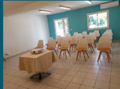
La salle de Nanon