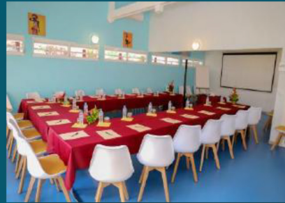
La salle du Fleuret

Nos 4 salles sont climatisées et peuvent accueillir entre 10 et 200 personnes.