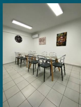
La salle du Violon