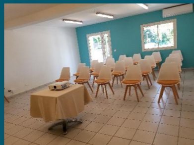
La salle de Nanon