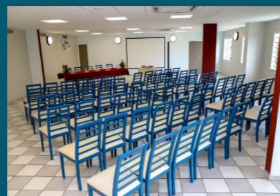
La salle Ernestine