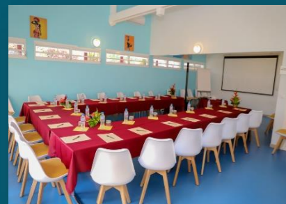
La salle du Fleuret

Nos 4 salles sont climatisées et peuvent être équipées de vidéo projecteur, écran, sonorisation, paperboard, bloc-notes, stylos, bouteilles d'eau et wifi.